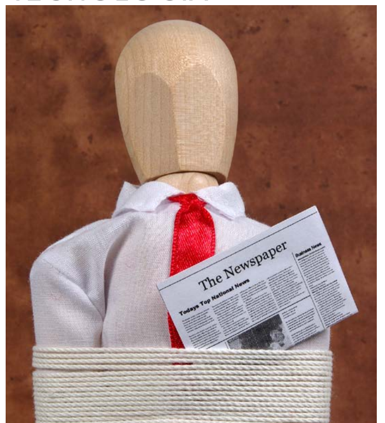
NUEVA APP PARA EVITAR EXTORSIONES

Impulsa tu Negocio, con el Turismo que visita Nuestro País!