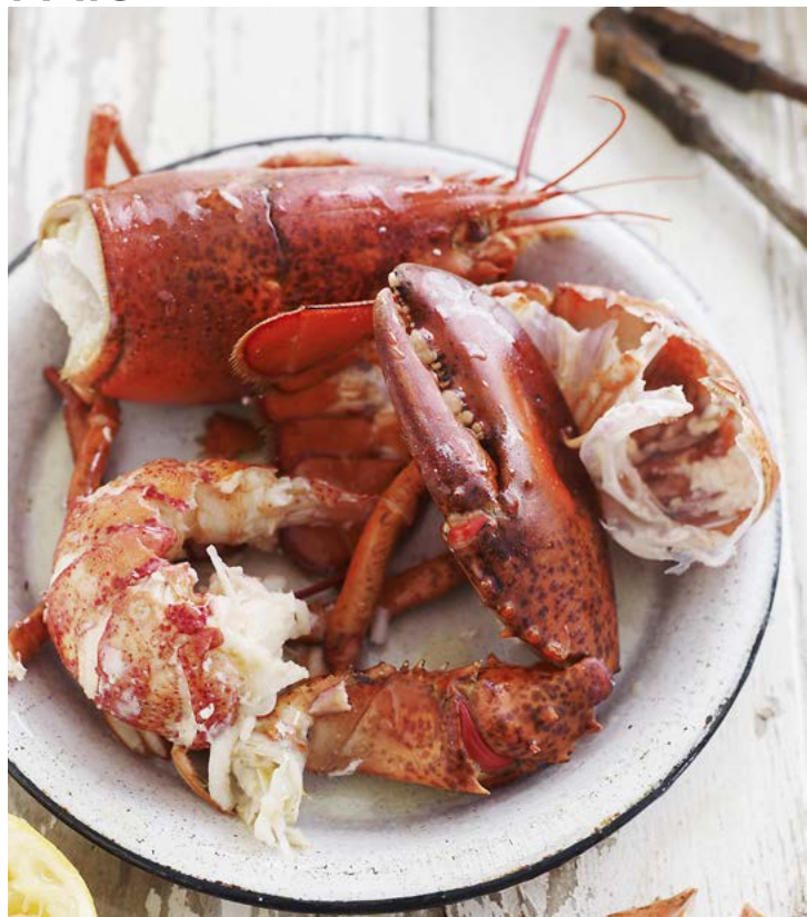
PROFECO ARRANCA PROGRAMA DE VERIFICA- CIÓN POR CUARESMA