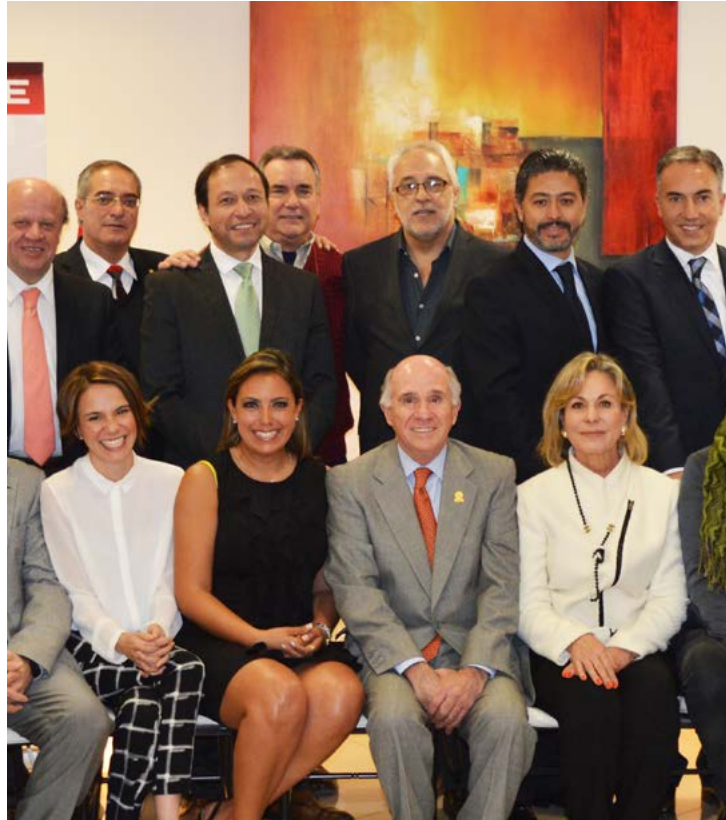
LXVII ASAMBLEA GENERAL ORDINARIA