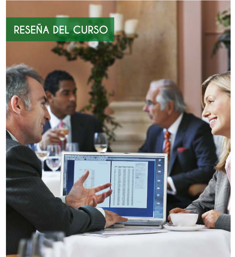
RESEÑA DEL CURSO