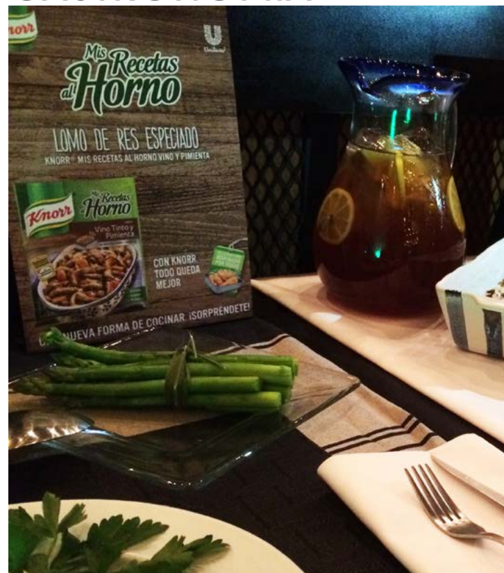
LO PRÁCTICO AHORA ES GOURMET