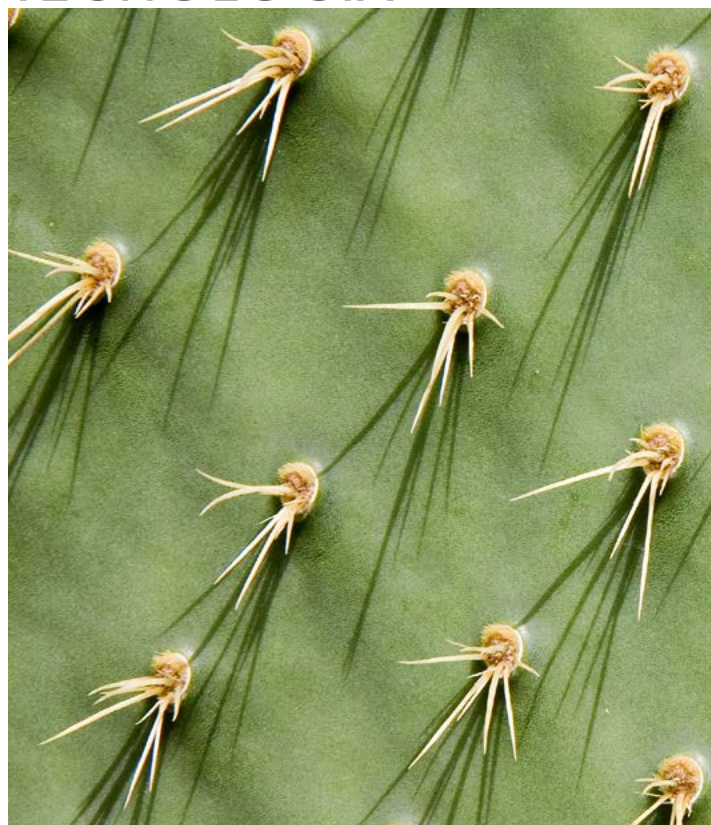
CREAN BIOGÁS Y ELECTRICIDAD A PARTIR DEL NOPAL