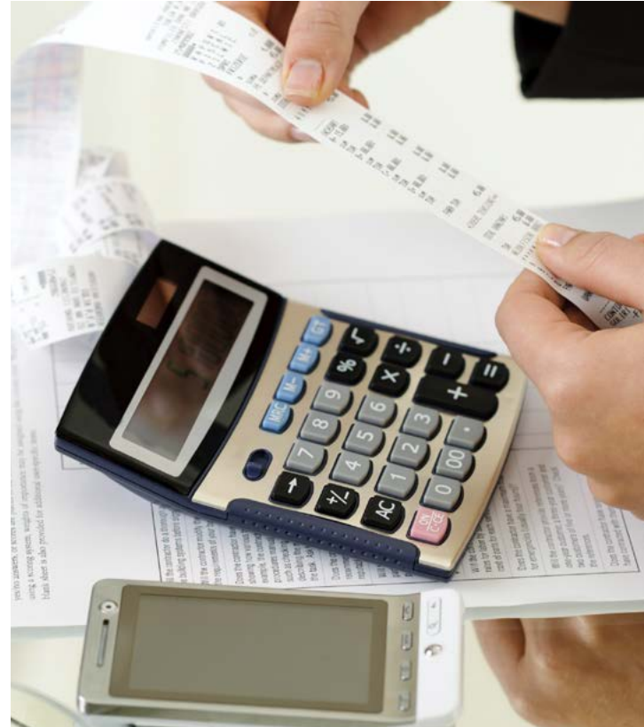
FACULTADES DE COMPROBACIÓN DE LAS AUTORIDADES FISCALES